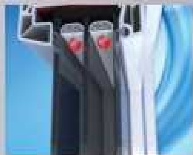
"Teplý" chromanem ramesek