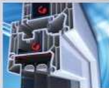
Výtužné ocelové profily