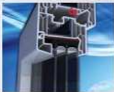
Střešové drenážní těsnění